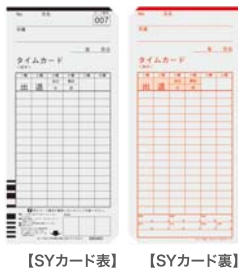
【SYカード表】 【SYカード裏】

SYカード (1箱100枚入り、日付印刷なし) 価格:¥1,890(税込) JAN:4974289490165