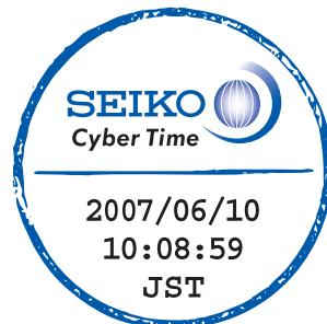
このマークはSEIKO Cyber Time時刻認証サービスが発行するタイムスタンプのイメージです。